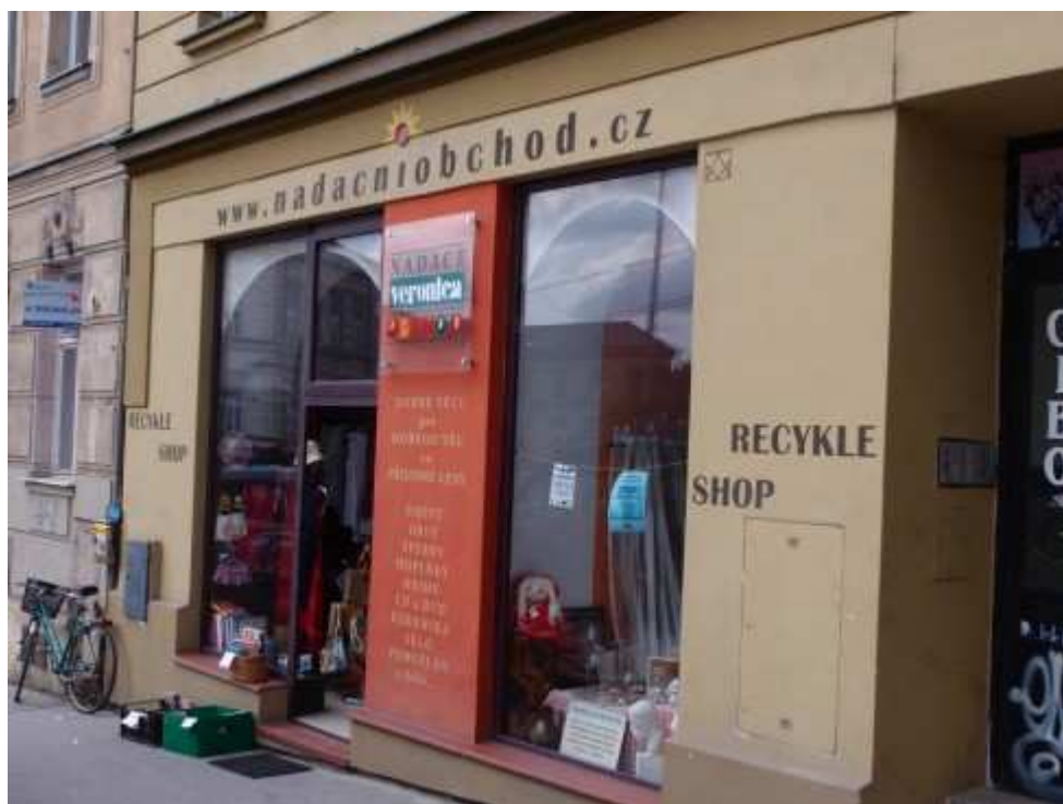
Obchod Nadace Veronica využívá zisky z prodeje darovaných věcí na podporu komunitních a ekologických projektů.

stejně důležitý jako péče o lidi a životní prostředí. Naplnění tohoto principu 3P může vypadat různě. V České republice jsou nejznámější takzvané integrační sociální podniky , které zaměstnávají lidi znevýhodněné na pracovním trhu. Sociálně zaměřené mohou být i jejich cíle, respektive nabízené produkty či služby, jak demonstruje právě příklad Sue Ryder. V každém případě by ale tyto podniky měly být přívětivé ke svým zaměstnancům i dalším lidem.