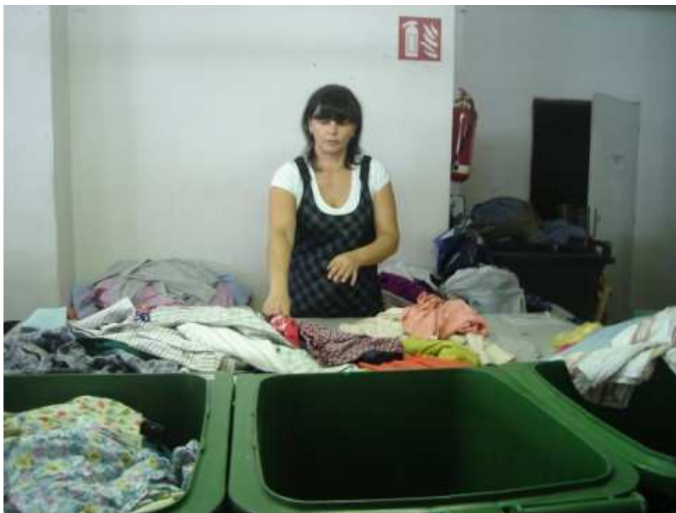
Třídění textilu Diakonie Broumov – tady se rozhoduje, které oblečení darovat potřebným a které zpracovat jinak.